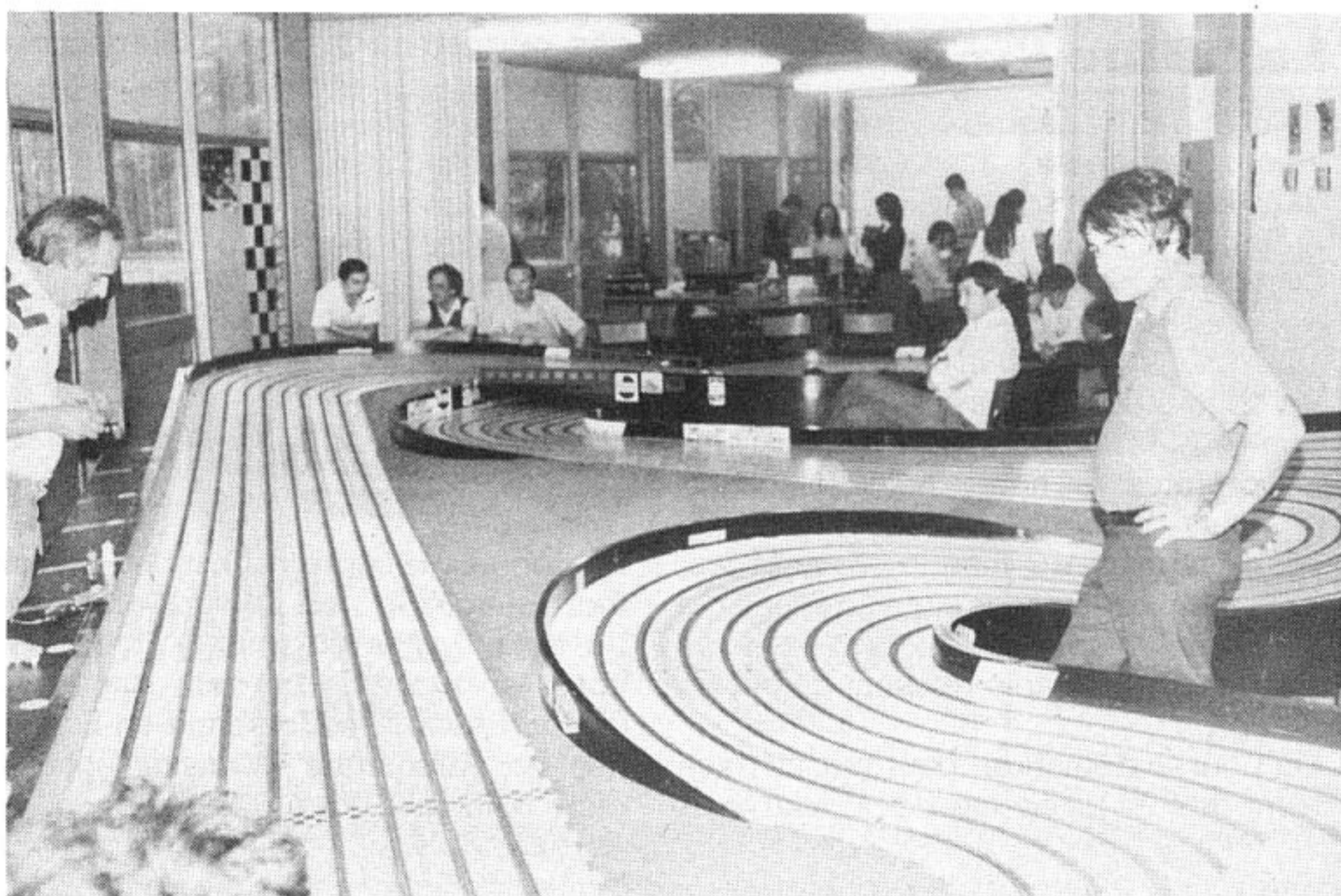
La piste de Bordeaux.