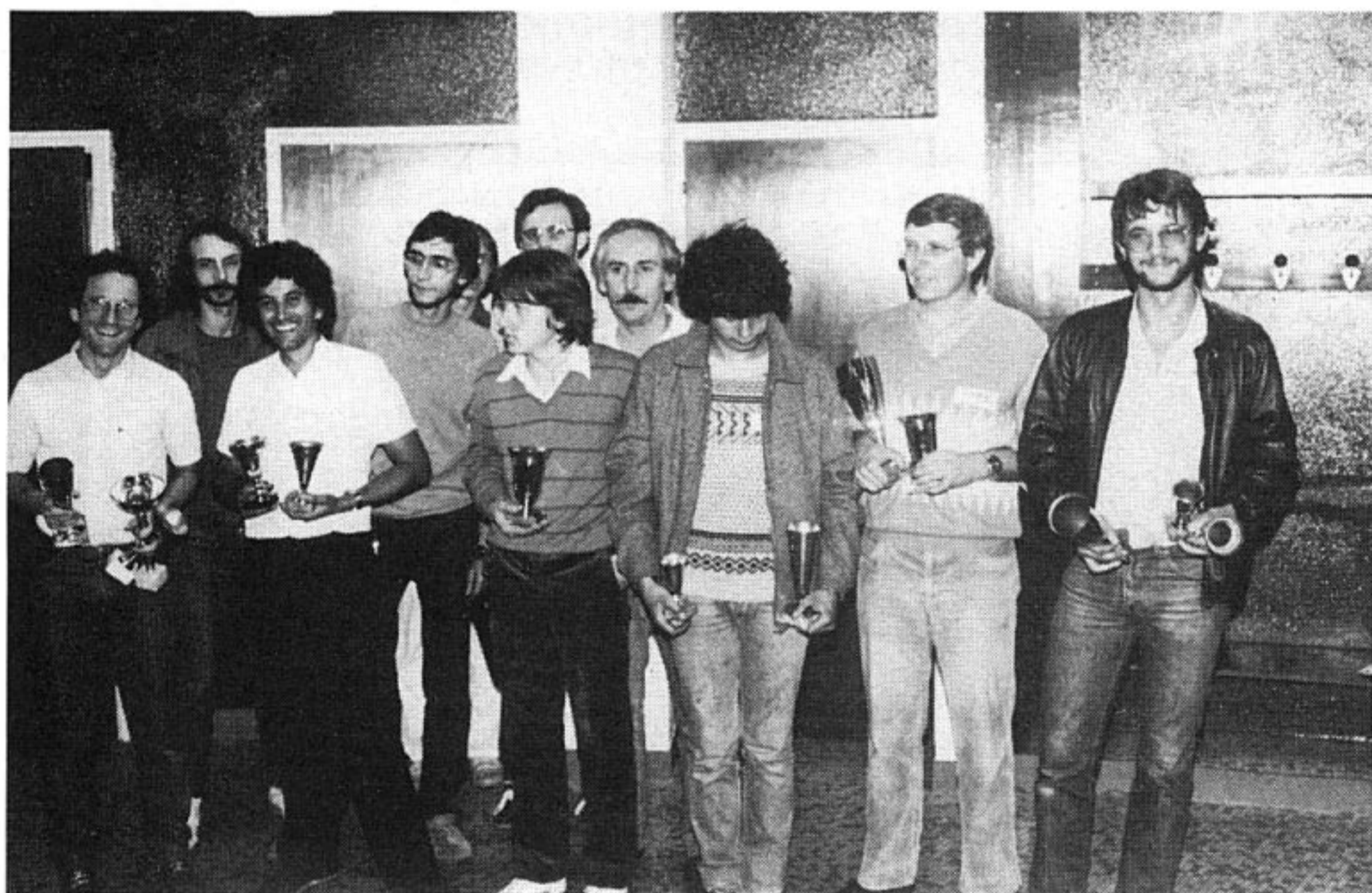
Les représentants des principaux clubs français.